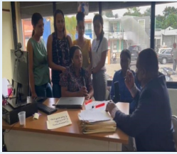
Entrevista a nuestras nuevas instalaciones.