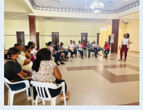
Taller de capacitación al personal.