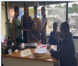
Entrevista a nuestras nuevas instalaciones.