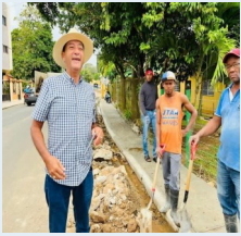
Reparación de aceras y contenes.