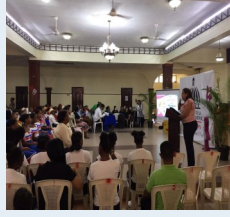
Efemérides del día del arte.