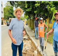
Reparación de aceras y contenes.