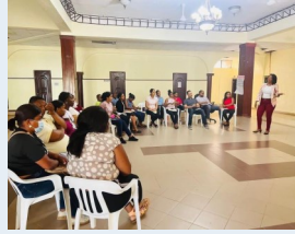
Taller de capacitación al personal.