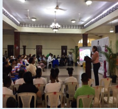
Efemérides del día del arte.